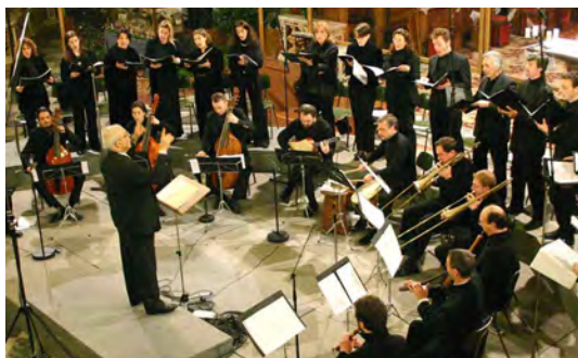
La Stagione Armonica