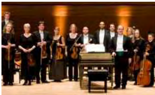
Dunedin Consort & Players _____

Malgrat l'èxit assolit amb l'obtenció del Txaikovski el 1966, la carrera internacional de Sokolov no va començar a ser reeixida i mereixedora d'una atenció especial fins a finals de la dècada dels vuitanta. Des d'aleshores, però, Sokolov és aclamat com un dels més grans pianistes de l'actualitat. Amb una segell personal indiscutible, la cita a Torroella de Montgrí es consueix com un dels moments àlgids en la història del festival torroellenc.