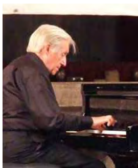
Joaquín Achúcarro _____

Un dels projectes que l'ha portat a un reconeixement unànim és la interpretació de la banda sonora del film La Passió de Joana d'Arc de C.Th.Dreyer amb música del lituà Bronius Kutavičius.