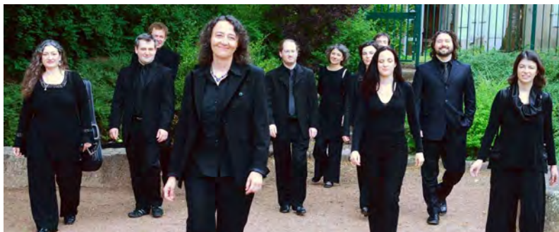
Orfeo 55 _____

Nathalie Stutzmann és Chevalier des Arts et Lettres i ofereix classes magistrals arreu del món.