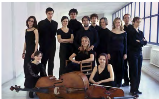
Berg Chamber Orchestra _____

Alice Sara Ott va ser guardonada amb el premi Jove Artista de l'Any en els Premis Klassik Echo l'octubre de 2010.