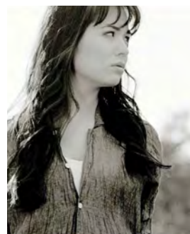
Alice Sara Ott