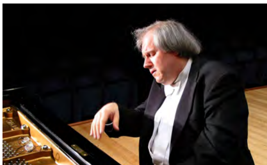
Grygory Sokolov _____

Els més destacats del seu calendari, però, en la temporada 2010-2011 ha estat el llançament i els concerts de la seva tercera col·laboració amb Jan Garbarek per ECM: Officium Novum que s'està presentant arreu d'Europa i que arribarà al Festival de Músiques de Torroella de Montgrí el diumenge 31 de juliol.