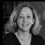
ELOÍSA DEL PINO Presidenta del Consejo Superior e Investigaciones Científicas de España (CSIC)