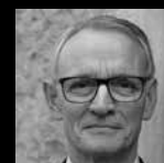
ANTÓN COSTAS Presidente del Consejo Económico y Social de España (CES)