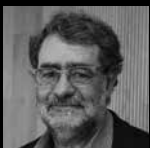
JOAN FONTCUBERTA Fotógrafo, artista conceptual, ensayista y teórico de la imagen