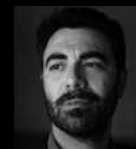
SANTIAGO ZABALA Profesor de investigación ICREA y profesor de Filosofía Contemporánea y Política en la Univ. Pompeu Fabra (UPF)