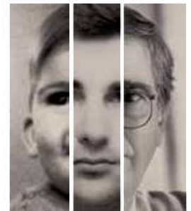
Lluch d'infant, de jove i pocs mesos abans de la seva mort.