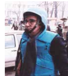
En missió de reconeixement a Bòsnia.