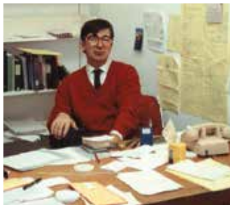
Princeton, EUA, 1989.